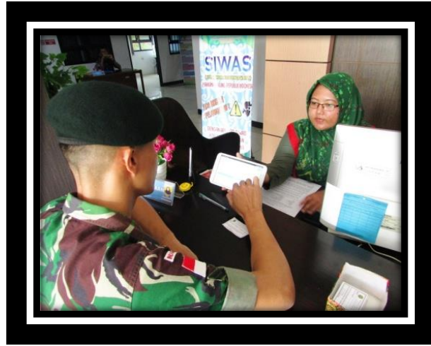
AFTER MENGGUNAKAN DIGITAL